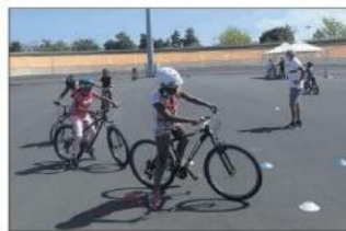
Savoir rouler ne fait pas tout, il faut surtout apprendre à partager la voie publique.

En effet, la pratique du vélo se fait de plus en plus rare, comme le stipule Jérôme Pépin, « avec les nouvelles technologies, les enfants font moins d'activité sportive. Pour les parents, l'engagement est plus en retard à la maison avec un écran, que dans la rue en