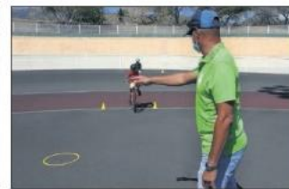
C'est au vélodrome de Champ-Fleuri que sont organisés les ateliers d'apprentissage au vélo.

attiré de faire du vélo. C'est aussi dans cette optique que les ateliers sont mis en place, au jeune à leur sécurité mais aussi à leur santé. »